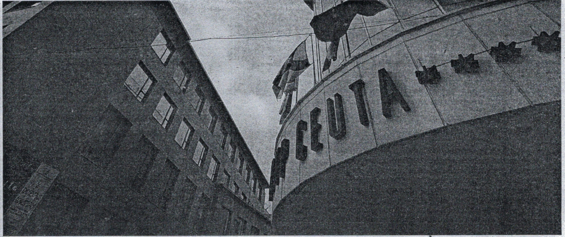
El Gobierno de Vivas inició esta legislatura estudiando enajenar el inmueble de Gran Vía, opción que se desechó en 2012.

La metodología será "activa y participativa". Además, se realizarán diferentes ejercicios y actividades fuera del aula que amplíen y refuercen los contenidos. También se pondrán a disposición del alumnado tutorías y obligación de mantener entrevista con el tutor del curso.