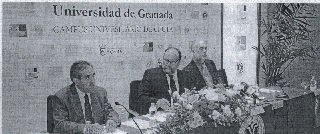
Los decanos opinan que hay que "revalorizar la docencia y la gestión en los Campus de la Universidad de Granada en Ceuta y Melilla".

Por añadidura, a los decanos de Ceuta y Melilla les gustaría que en las contrataciones se incorpore un compromiso de permanencia en el Campus en cuestión de "al menos un quinquenio", "potenciar" el profesorado con vinculación permanente y poder promover una oferta de optatividad "similar a la de Granada".