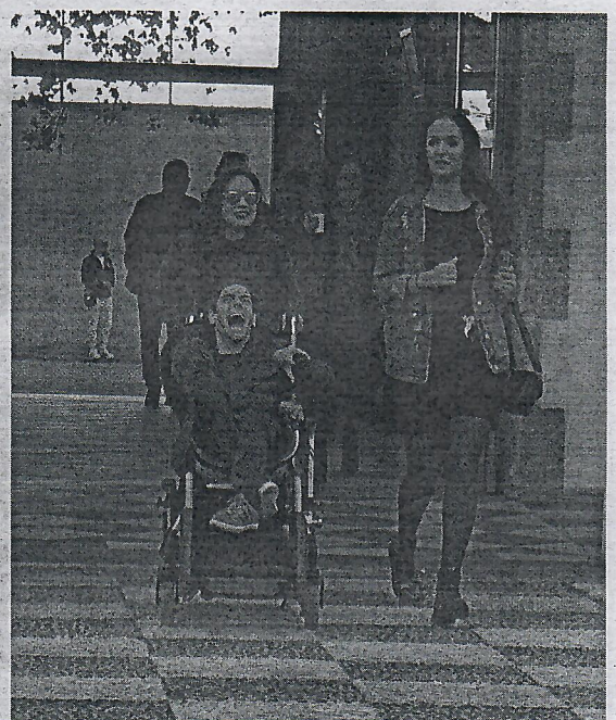
La Milla Solidaria ha cumplido ya su quinta edición y cada vez son más las personas que se inscriben.

minar la semana y siempre traemos una persona mediática. El año pasado fue el Langui, éste Pablo Pineda y ya estamos barajando la visita del próximo año".