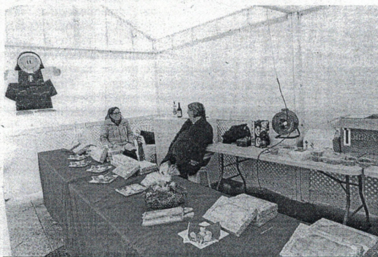
El puesto de dulces estará en el Revellín hasta mañana.

Pueden contemplarse, saborearse y adquirirse todo tipo de pasteles elaborados artesanalmente que tienen cabida en la exposición, entre los que destacan: los polvorones, tejas, roscos buen paladar, tortas de polvorón, mantecados de canela y vainilla, peñorillas, yemas de almendra o las tradicionales encomiendas que año tras año hacen las delicias de los asistentes. Para las hermanas esta iniciativa es una actividad de las más importantes de su obra social durante el año, ya que las ganancias que se sacan de la venta de estos dulces sirven para ayudar a sufragar los enseres que desde el convento compran para abastecer a los desamparados.