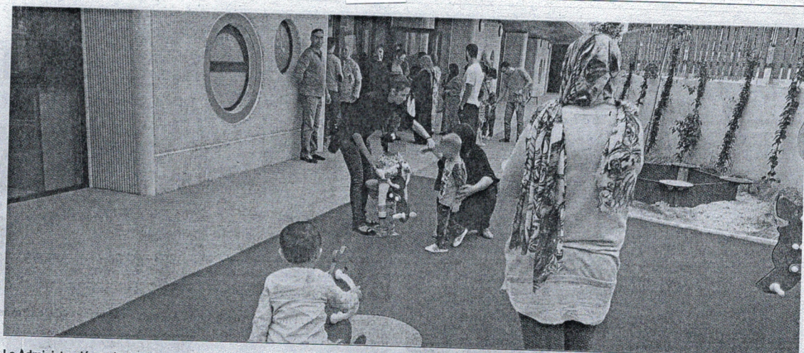
La Administración no incluyó las nuevas aulas en el proceso general de escolarización, por lo que el número de matriculados es de momento pequeño.