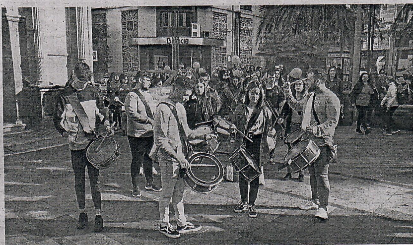
La batucada sonó bien fuerte para hacerse oír en contra de esta violencia de género.

Un total de 1.027 mujeres han muerto a manos de sus parejas o ex parejas desde 2003 y solo en lo que va de año la cifra asciende a 51. En manos de todos está acabar con este estigma y son muchas las asocia-