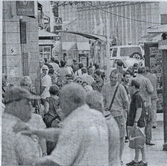
Los miedosos son más reacios a la interacción y el contacto con los demás.

En él, concluyen que la población ceutí refleja "niveles medios