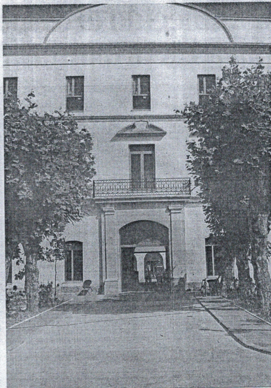
Piden mejoras para el campus universitario de Ceuta.

En lo relativo al personal de administración y servicios la demanda se dirige hacia la puesta en marcha de una RPT que permita una adecuada delimitación de funciones.