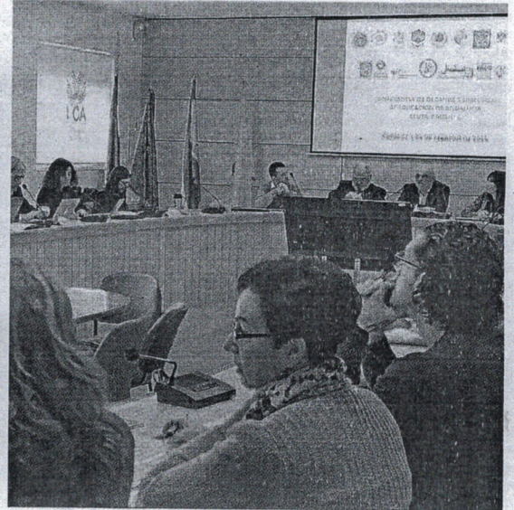
La conferencia se ha celebrado durante dos días en la Universidad de Cádiz.

Si en duda en Cádiz se ha producido un consenso respecto a la necesidad de apostar por un sistema, el educativo, que hasta ahora ha estado apartado de los deberes políticos y, por