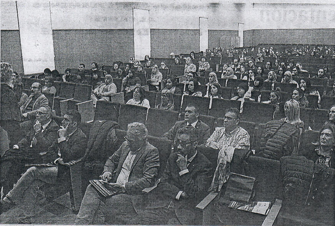
Las jornadas, que se desarrollan en el salón de actos del campus universitario, contó con una importante afluencia de público.