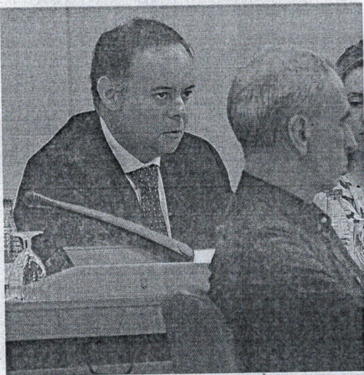
Celaya advirtió que el Ministerio debería dar su visto bueno al proyecto.