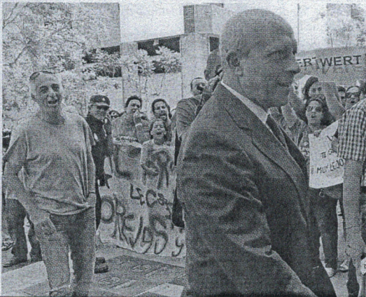
de los manifestantes tanto ante la Biblioteca como en el Campus.

Desde el punto de vista de las centrales sindicales "todo lo que han dicho en Ceuta los representantes de su Gobierno y los del Ejecutivo local del PP no ha sido más que una gran patraña". "La Educación en esta ciudad está muy enferma y está siendo muy maltratada por su Ministerio, que no solamente no resuelve los problemas sino que los va recrudeciendo, llevando la ratio de Infantil para el próximo curso a 30 niños por aula", ejemplificó.