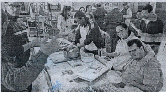
Destacan la buena relación entre profesionales y usuarios.

do llegó no sabía qué reacción iban a tener los usuarios respecto a él, cuando de repente se le acercó uno de ellos, le dio la mano y le abrazó. "Eso te alegra el día", apunta.