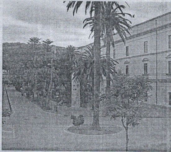
Los alumnos interesados ya pueden matricularse.

El alumnado que quiera matricularse de una segunda mención deberá cumplir dos requisitos. Por un lado, tener superada una primera mención en el Grado en