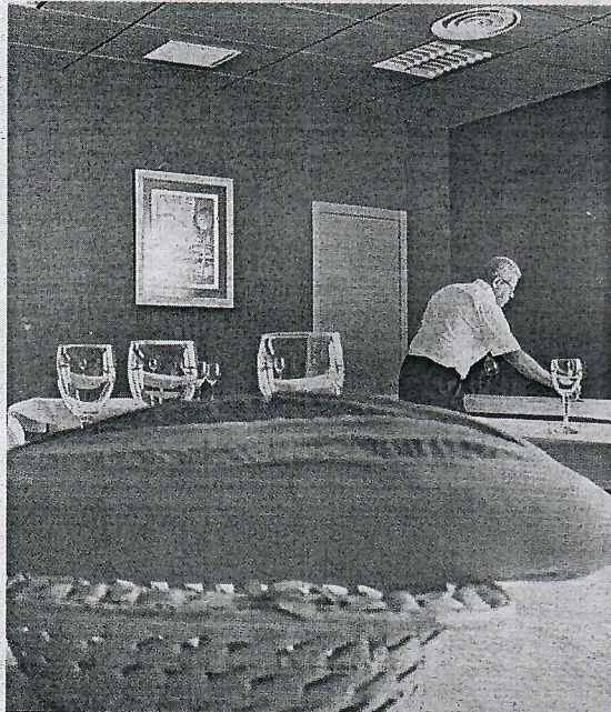
EL FARO La UGR pretende restablecer el servicio de cafetería-comedor cuanto antes.