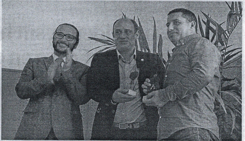
También se entregaron premios a los ganadores de las competiciones deportivas celebradas estos días.