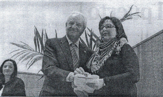
Asociaciones, empresas e instituciones recibieron su reconocimiento.