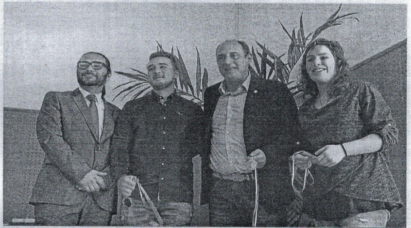
Los alumnos han celebrado diversos concursos con motivo de su Patrón.