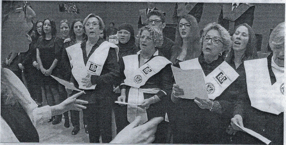
El coro del Aula Permanente de la UGR y alumnos de la Facultad entonaron juntos el 'Gaudeamus Igitur' para finalizar el acto por Santo Tomás de Aquino.