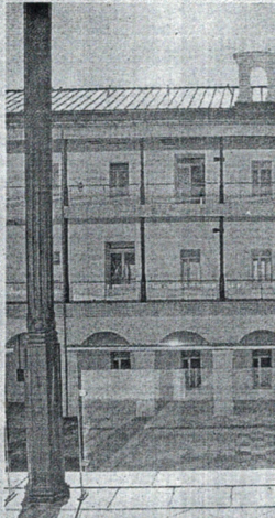
Imagen del Campus.

EDUCACIÓN. El Vicerrectorado de Estudiantes y Empleabilidad abrió ayer el plazo para solicitar, hasta el 22 de diciembre, alguno de los 160 premios para la adquisición de libros a los mejores expedientes académicos en el curso 2016-2017. Los 160 premios convocados, lo serán por un importe de 240 euros cada uno, canjeables únicamente por libros de texto o material que esté directamente relacionado con los estudios cursados. La distribución de las ayudas, se llevará a cabo entre las distintas titulaciones impartidas en Centros de la UGR y se realizará atendiendo al número de estudiantes matriculados en cada una de ellas, en el curso 2016-2017, procurando que "al menos corresponda una ayuda por titulación", según establecen las bases de la convocatoria.