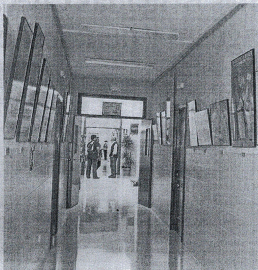
La fase presencial del curso se desarrollará desde hoy en el CPR.