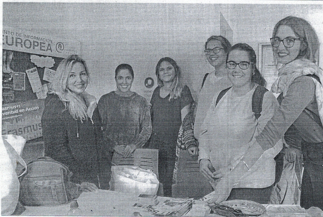
Jóvenes estudiantes tuvieron ayer la oportunidad de someterse a la prueba del VIH en un aula habilitada en el Campus.