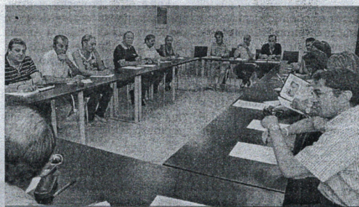
Un tercio de los integrantes debe firmar la solicitud de convocatoria.

educativa y, al menos, "deje a los docentes que se dediquen a su trabajo" y no a "rellenar papeles inútiles". El Reglamento del Foro establece que podrá celebrar reuniones con carácter extraordinario "cuando lo soliciten al menos la tercera parte de los vocales del Pleno mediante escrito dirigido al presidente, debidamente firmado, en el que se expondrán los motivos que justifiquen la convocatoria y los asuntos a tratar".