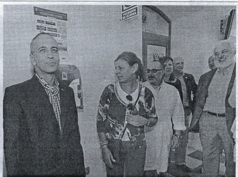
Los consejeros de Sanidad y Educación, junto a los representantes de la UNED, UGR e Instituto de Idiomas.

A preguntas de los periodistas sobre el requerimiento de los socialistas a la Consejería de Educación para que aporte la memoria de la guía educativa Ceuta te enseña , Deu aclaró que resulta innecesaria la solicitud del PSOE porque "año tras año se presenta la nueva guía y siempre se hace un balance de actividades". Los