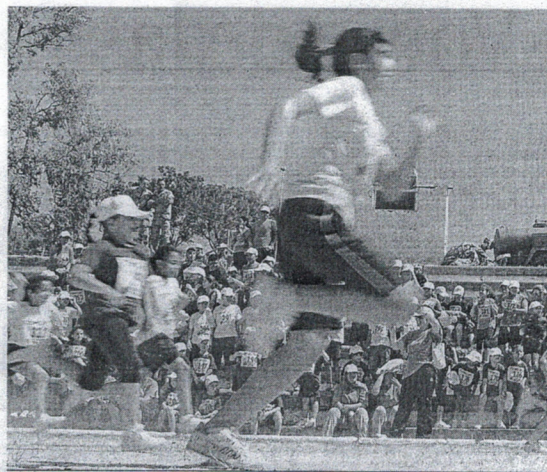
Los secretarios de estado de Deportes y Educación estudian la iniciativa.

la mayor participación de los centros médicos de la Ciudad Autónoma para que impulsen programas de Actividad Física y Deporte para la población en general, y aquellos orientados a los mayores, los discapacitados y las personas en riesgo de exclusión social.