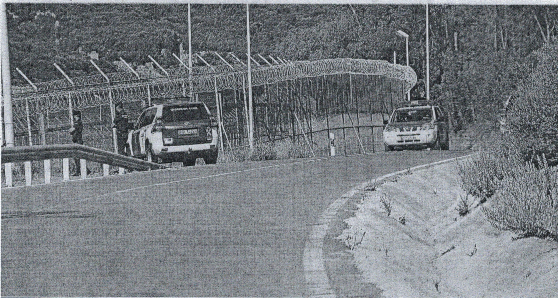
Las obras en la carretera que recorre el perímetro fronterizo y en la que lleva al Tarajal desde en el centro deben recibir este año más de 9 millones.