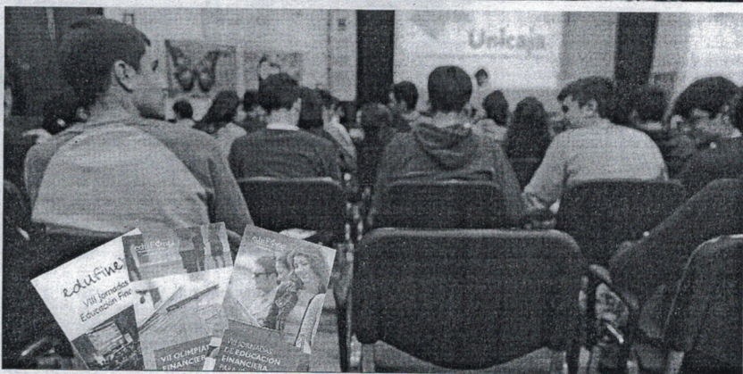
Los alumnos del Camoens han sido los primeros de la Ciudad Autónoma en recibir esta formación.

lidad o temas de actualidad. Las jornadas comenzaron el pasado mes de octubre en Málaga y Sevilla y se desarrollarán, hasta finales del presente mes en por todas las provincias andaluzas, así como en Castilla y León, Castilla-La Mancha y Extremadura, donde,