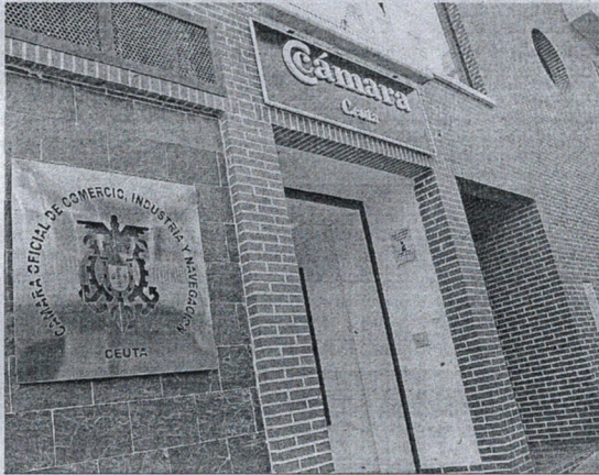
El curso está impulsado por la Cámara de Comercio de Ceuta.

El taller estará dirigido por Sunder, consultores especializados que dinamizarán los debates y expondrán los temas de interés, el taller se fundamenta en ejercicios interactivos y exposiciones, para a través de las expectativas y experiencias personales de los propios