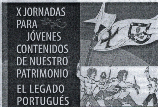
Imagen del cartel anunciador.

La cita está dirigida a estudiantes de secundaria y bachillerato que estén interesados por la historia de Ceuta, tiene una parte teórica, que