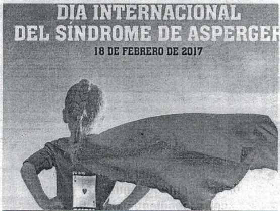
El stand permanecerá desde las 11.00 hasta las 20.00 horas.

La Organización Mundial de la Salud decretó el 18 de febrero como el Día Internacional del Síndrome de Asperger un año después de que coincidieran, en 2006, los 100 años del nacimiento del pediatra Hans Asperger, quien descubrió el síndrome, y los 25 años de la publicación en la que Lorna Wing acuña el término.