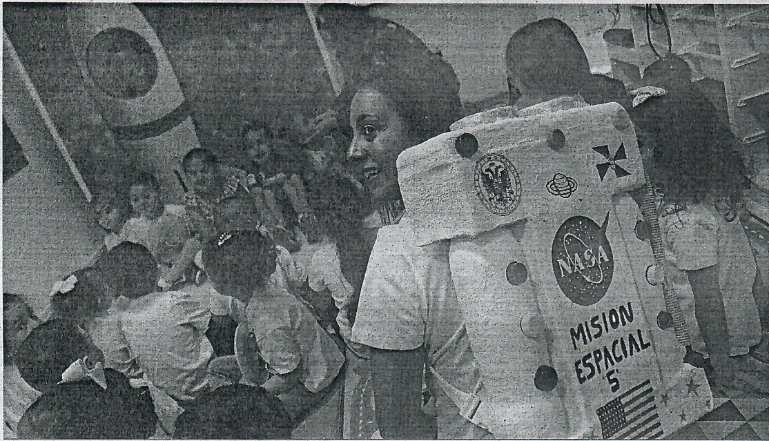
La innovación mejora la imagen de los centros, que se benefician de más matrículas y "un significativo aumento" de los recursos de distintas fuentes.