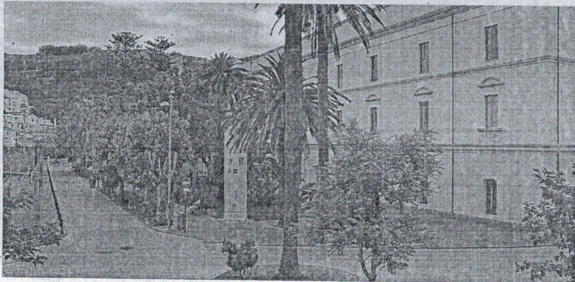
La Facultad de Educación inicia el curso con grandes novedades.