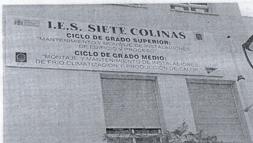
Los docentes apelan en la carta a la larga trayectoria del ciclo, y la necesidad de su instrucción, entre otros. EL FARO