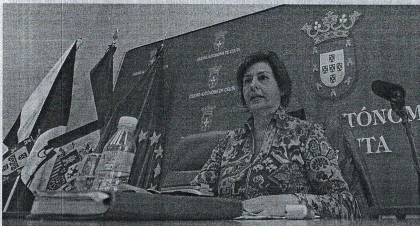
Deu se felicitó por que el equipo ministerial bajo la dirección de Wert “sí cumple sus compromisos con Ceuta”.

EDUCACIÓN. El IES ‘Luis de Camoens’ celebrará hoy de 9.30 a 14.00 horas la festividad de Santo Tomás de Aquino. A primera hora comenzarán las finales de las distintas competiciones deportivas organizadas. Durante toda la mañana habrá actuaciones musicales, bailes y concursos, stands culturales... Todo lo recaudado a lo largo del día tendrá un fin benéfico.