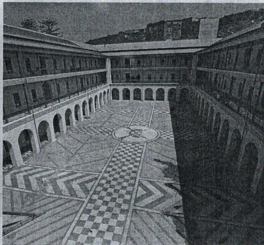
Las conferencias tendrán lugar en el aula 10 del Campus Universitario.