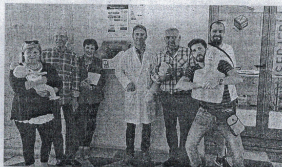
Los dos cursos se han impartido durante esta semana.

ciones y la UGR considera que con esta actividad "se refuerza y mejora la atención ante una parada cardiorrespiratoria, intentando aumentar la supervivencia y la disminución de secuelas en estos casos, ya que la actuación de los primeros intervinientes haciendo uso de un DEA en los primeros minutos resulta clave para conseguir estos objetivos".