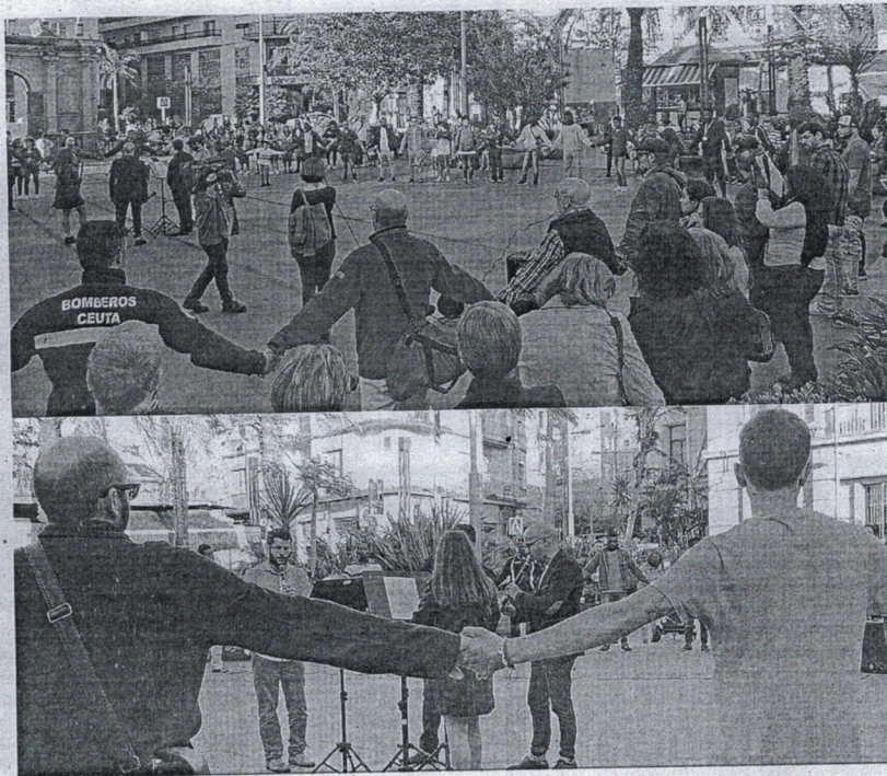
'La rueda de hombres' congregó a un numeroso grupo de varones y mujeres que clamaron contra la violencia de género.

Los interesados deberán presentar las obras reforzadas con soporte rígido. En el dorso de cada obra figurará un lema, adjuntándose las mismas en sobre cerrado en la que figurará el mismo lema.