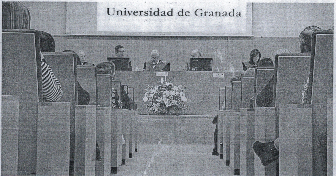
El decano de Facultad "ostenta la representación de su centro y ejerce las funciones de dirección y gestión ordinaria de esta".

"Impulsar las relaciones del centro con la sociedad" es otra de sus misiones concretas, como la de "informar, de acuerdo con el plan de ordenación docente, sobre la labor académica del profesorado" o "cualquier otra" que se le deleguen.