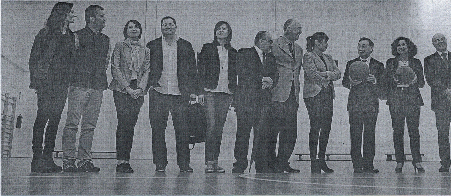
Los representantes de la Ciudad Autónoma y de la Universidad de Granada, ayer, en la pista polideportiva cubierta habilitada en la planta superior del edificio anexo al antiguo acuartelamiento del Teniente Ruiz.