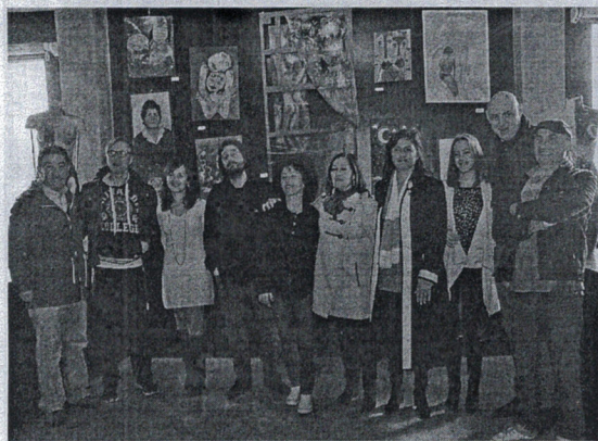
La consejera Deu inauguró la exposición junto a los artistas. QUINO