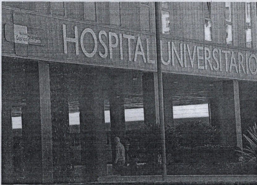
El PSOE ha llevado el asunto hasta el Congreso para conocer la realidad sobre el asunto.