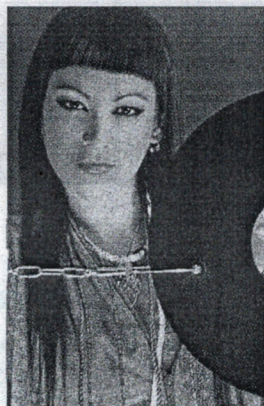
Actuará en la Asociación 'La Peña'.