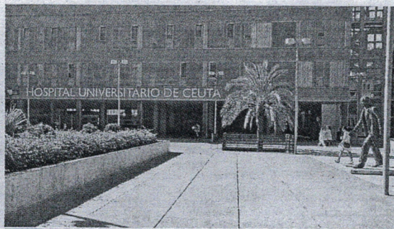
En el Hospital hay muchos alumnos de Enfermería haciendo prácticas.

● El encuentro tuvo lugar en la sede del Rectorado granadino el pasado lunes por la tarde