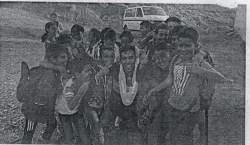
Los jóvenes están viviendo una rica experiencia cultural, deportiva y de sostenibilidad.