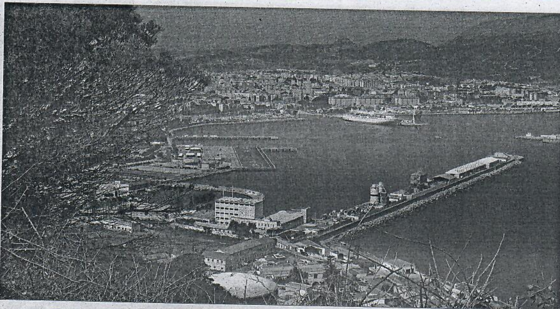
La consultora debe, entre otras tareas, "sistematizar" las ventajas que el REF de Ceuta "supone para la implantación de empresas en la ciudad". EL FARO