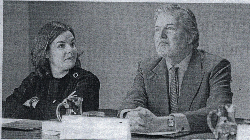
La llegada del nuevo ministro de Educación ha sido clave en este cambio.

Con anterioridad, esos contactos no es que no existieran, pero, desde luego, a pesar de ser del mismo color político, desde el mismo Gobierno ceutí se entendía que faltaba un entendimiento más profundo, debido sobre todo a la colaboración que se les prestaba desde el Ejecutivo presidido por Juan Vivas. Sin embargo, todo cambió de la noche a la mañana, con la llegada del nuevo