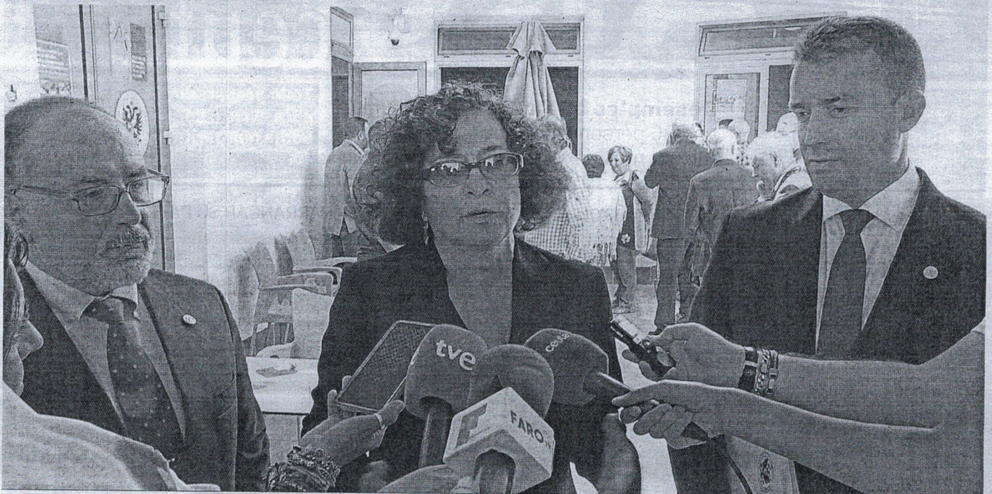
La rectora atendió a los medios de comunicación en un descanso de la toma de posesión de los dos nuevos decanos.