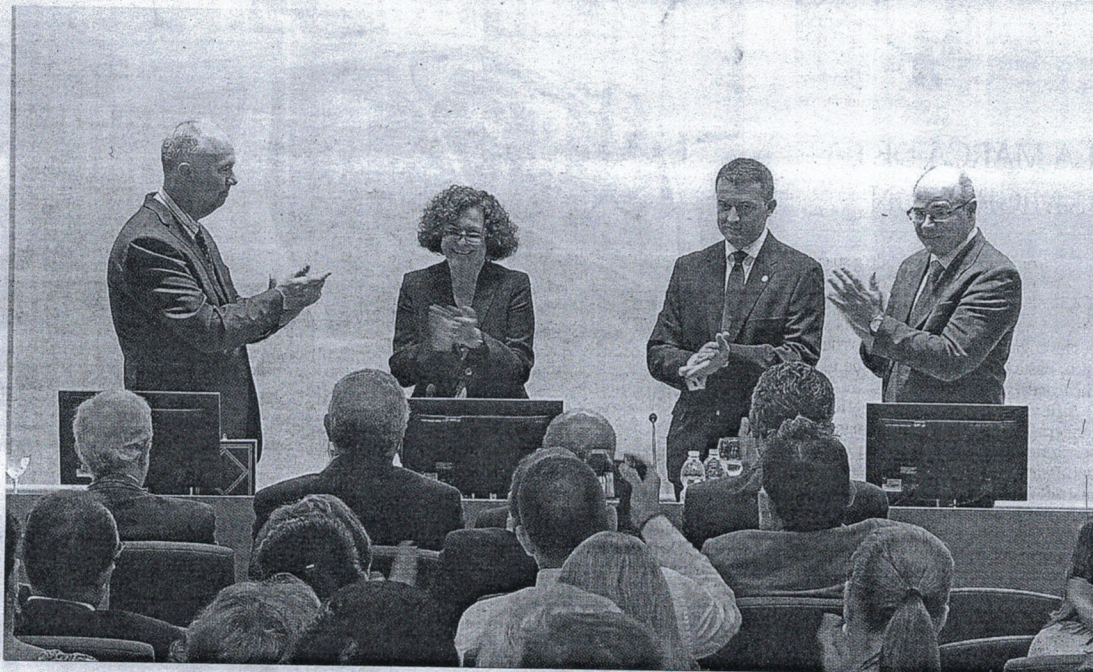
El acto tuvo lugar en el Salón de Grados del campus universitario de nuestra ciudad.

Además, defendió que los dos decanos ya trabajan conjuntamente para, por ejemplo, la ampliación de las infraestructuras. Sobre este particular, concretamente aludió a que se está viendo la posibilidad de incrementar los espacios utilizando la parte superior de los garajes para el establecimiento de unos laboratorios destinados a la Facultad de Ciencias de la Salud. También, entre las previsiones de la Universidad de Granada en relación con el campus de Ceuta, se encuentra la negociación de dobles grados y en este punto concreto, la rectora dijo que se haría con Facultades extranjeras "lo que sería muy interesante para nuestros alumnos" y en tercer lugar, el establecimiento de un nuevo Máster en el campo de la Educación. Tampoco descartó encontrar un salida en el caso de los estudios de Informática y Administración de la Empresa o la petición que le hizo el presidente de la Ciudad cuando mantuvieron hace un mes un encuentro, en relación con la creación de un nuevo grupo en Enfermería.