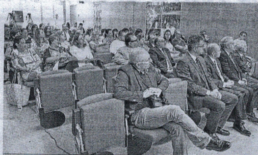
Entendimiento con las dos administraciones.