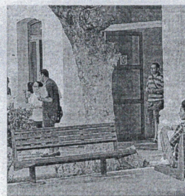
Los estudiantes manifiestan que los másteres son "esenciales".

En cualquier caso, el alumnado también reclama del Minis-