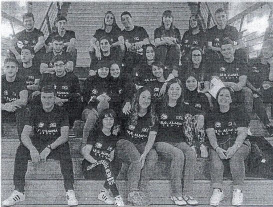
Alumnos del 'Almirante' trabajaron en Granadilla (Cáceres) en la última edición.

En concreto, el MECD acaba de convocar ayudas para un máximo de 700 alumnos de centros educativos españoles o alumnos de las secciones españolas de centros de otros países miembros de la UE, que cursen 3º y 4º de ESO y FP Básica, ciclos formativos de Grado Medio de FP y ciclos formativos de Grado Medio de Enseñanzas Artísticas y Bachillerato. Para esta actividad, se han destinado 71.628 euros, ofertando 300 plazas en Granadilla, así como 200 en Búbal y Umbralejo, respectivamente.