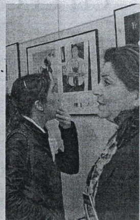
La muestra durará hasta abril.