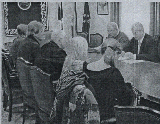
Los sindicatos tildan de "nefasta" la gestión del actual director provincial.

● Los sindicatos insisten en que no puede decir que no sabe de qué presión burocrática se quejan los docentes