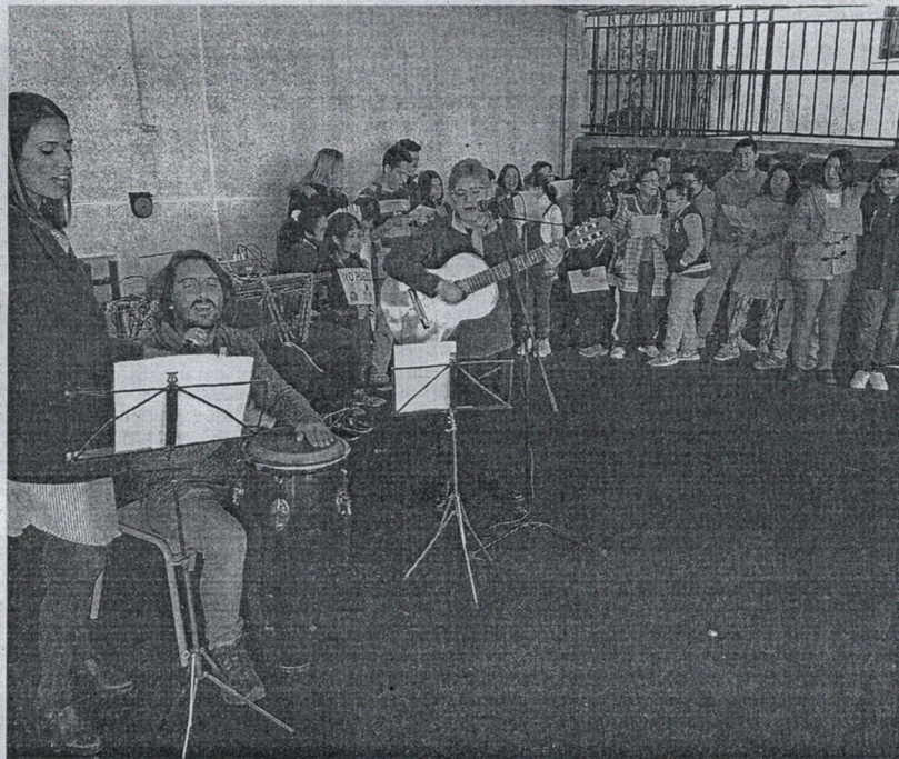
Imagen del acto celebrado ayer en el colegio de Educación Especial.

POLÍTICA. El Tribunal Central de Recursos Contractuales (TCRC) ha admitido el recurso contra el contrato de patrocinio aéreo que fue presentado por MDyC. El partido pidió esa nulidad por la "incapacidad del órgano contratante para llevarlo a cabo" por las "limitaciones de la competencia". Tras conocer esta decisión, MDyC ha pedido en el Consejo de Administración de Procesa la paralización de cualquier tipo de contratación de este tipo hasta que se haya resuelto el recurso por parte del TCRC.