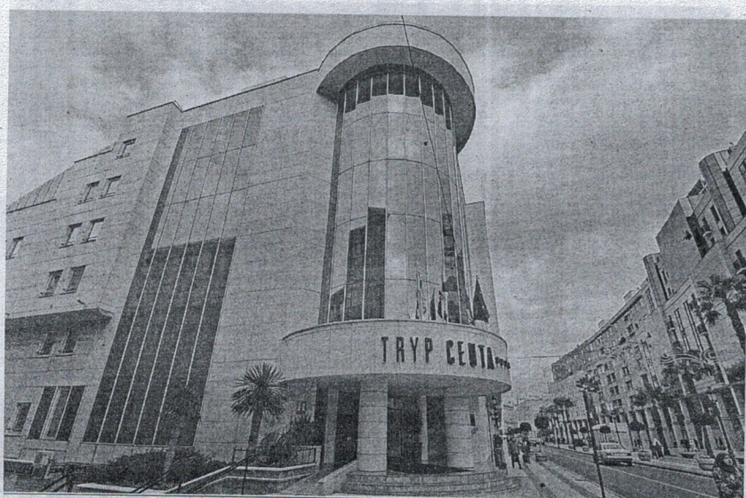
La venta del Hotel Tryp, construido en 1995, fue descartada por el Gobierno local hace año y medio.