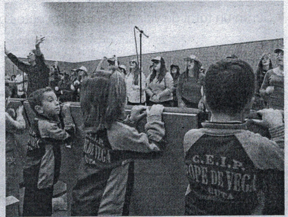
Este curso se reparten 6.070 becas entre Primaria y Secundaria en Ceuta.

nar a la financiación de estas ayudas un total de 637.000 euros. El pasado curso la Administración General del Estado ofreció un total de 5.970 becas por la misma cuantía que al cierre de la convocatoria dejaron a 200 niños sin ayuda a pesar de que cumplían todos los requisitos, simplemente por falta de presupuesto, según denunciaron FECCOO y la FAMPA.