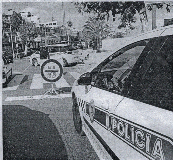
La Policía Local recuperó el vehículo en Narváz Alonso.

Por otro lado, también el jueves, agentes de servicio del 092 fueron avisados por la central porque en la Plaza de los Reyes una ciudadana había sufrido un tiron en el que le habían arrebatado el bolso. Según los datos aportados, se trataba de dos menores marroquíes que emprendieron la huida hacia la calle